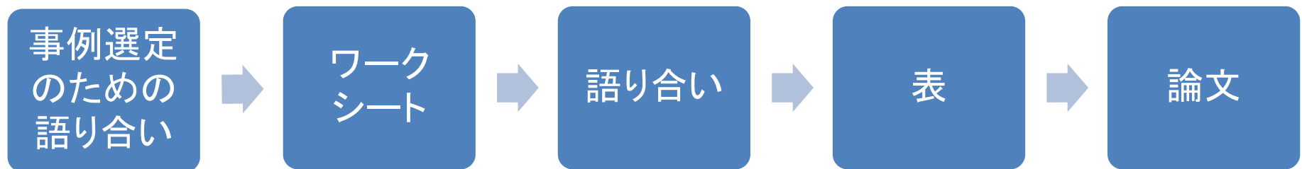
図. 事例研究のプロトコル(案)